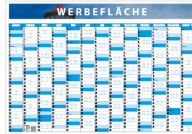
13-MONATS WANDPLANNER DATA